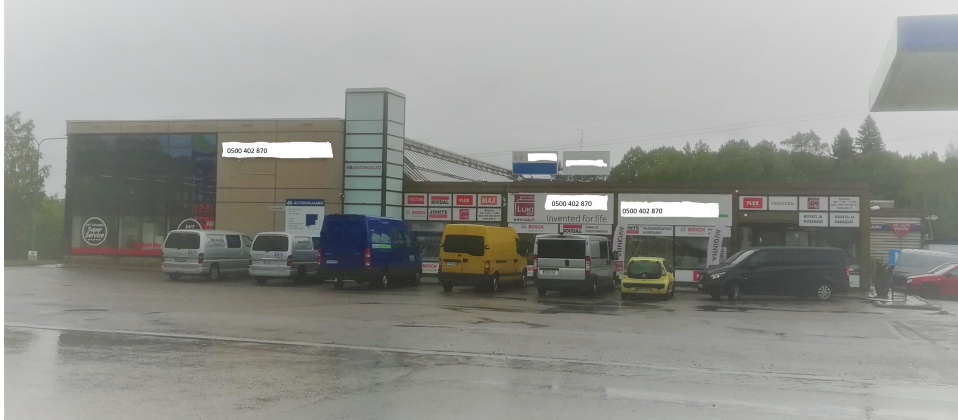
Liukumäentie 2, 00640 HELSINKI

Myymälä, varasto ym. toimitilaa. Rakennusvuosi 1976. Nosto-ovi.